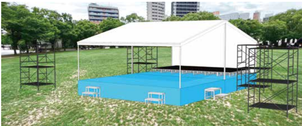
※実際のステージと相違ある場合がございます。